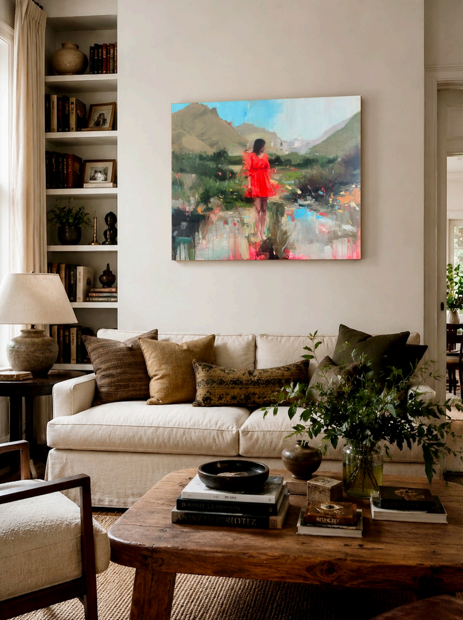
Vista en contexto / Interior privado