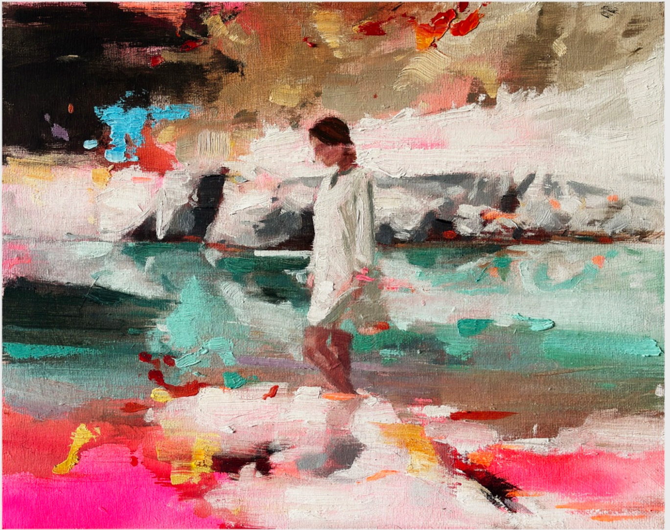
Figura en el Borde