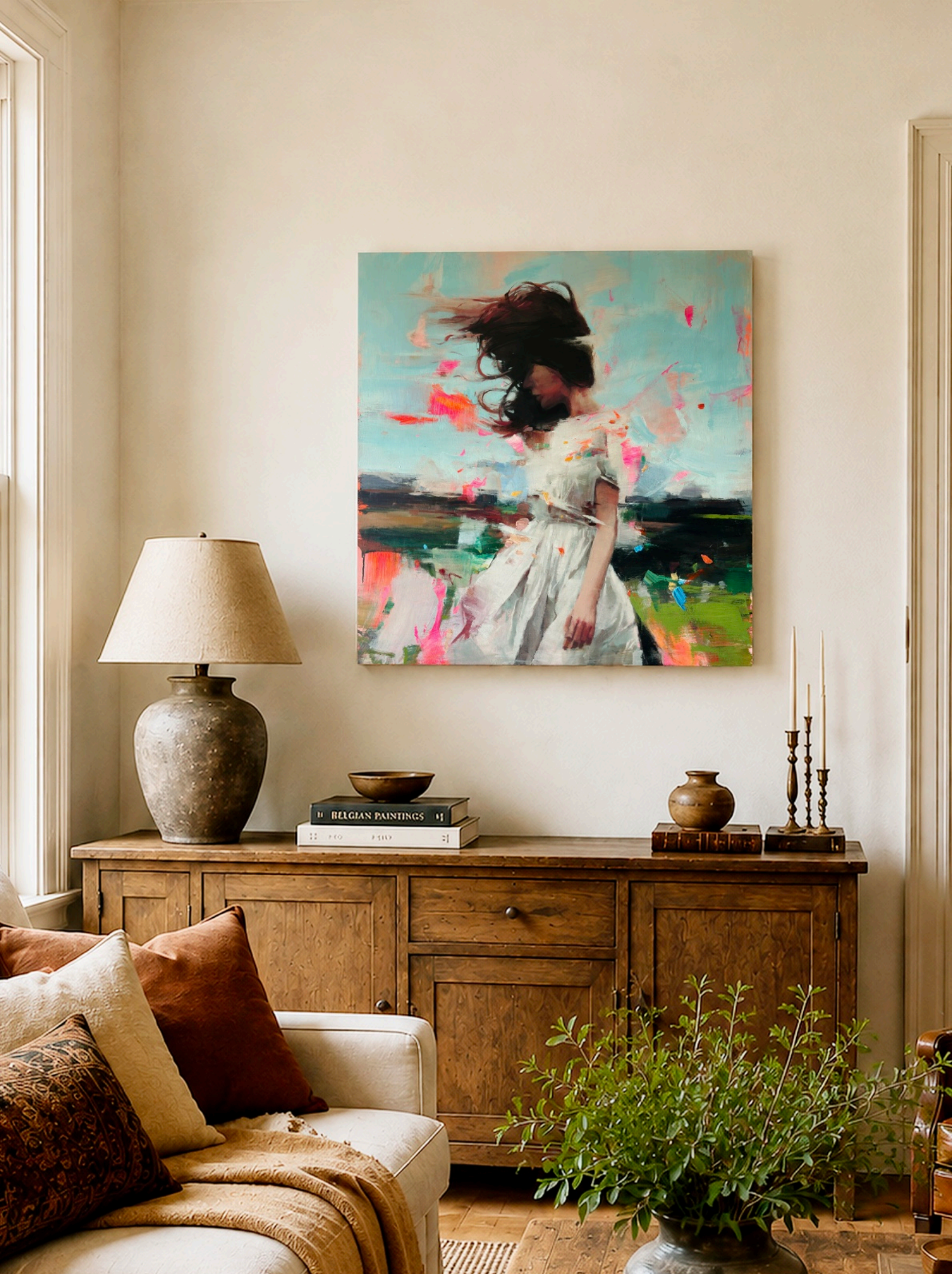
Vista en contexto / Interior privado